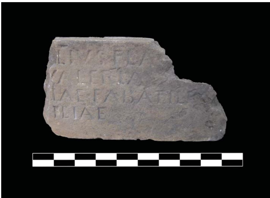
Fig. 1- Inscripción depositada en el Museo Arqueológico P. Alejandro Recio.

Además, al estar la pieza rota, desconocemos las medidas originales de la longitud. Lo que conservamos del soporte mide 0,85 metros de largo (en su punto máximo) por 0,47 metros de alto y la profundidad es de 0,145 metros (FIG. 1).