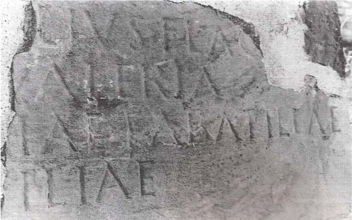
Fig. 3- Inscripción del Cortijo de Casablanca (ABASCAL, 1999: Lámina LXXIV).

Después de haber analizado cuidadosamente el epígrafe conservado en el Museo Arqueológico Padre Alejandro Recio de Martos, consideramos que se trata indudablemente del mismo fragmento epigráfico visto por García Gelabert en 1985, y publicado en 1999 por Cabrero y por Abascal, aunque su estado de conservación seguramente ha empeorado, en la tercera línea ha desaparecido AE, sólo se puede leer la parte superior de la letra A, dificultándose todavía más su posible lectura.